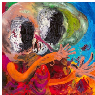
Einfach monströs Butzers „Nasaheim“ von 2001