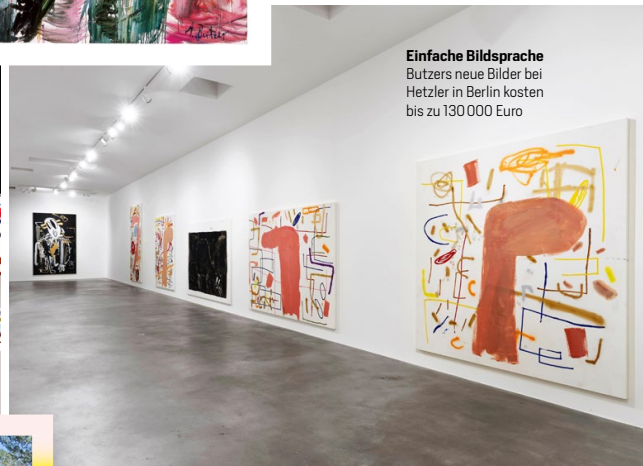
Einfache Bildsprache Butzers neue Bilder bei Hetzler in Berlin kosten bis zu 130 000 Euro