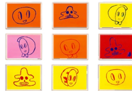
Einfach gedruckt Butzers Neuner-Grafikserie (2021) für 18 000 Euro, die Auflage ist 75. Bei taschen.com

unbeschwerte Leben zwischen Disney World und Fast Food im Sunshine State Kalifornien. Von dort ist der einst junge Wilde aus Stuttgart, der 1996 von der Hamburger Kunstakademie flog und dennoch Karriere machte, 2021 nach Berlin zurückgekehrt. Wir sprachen mit dem 48-Jährigen über neue und alte Bilder.