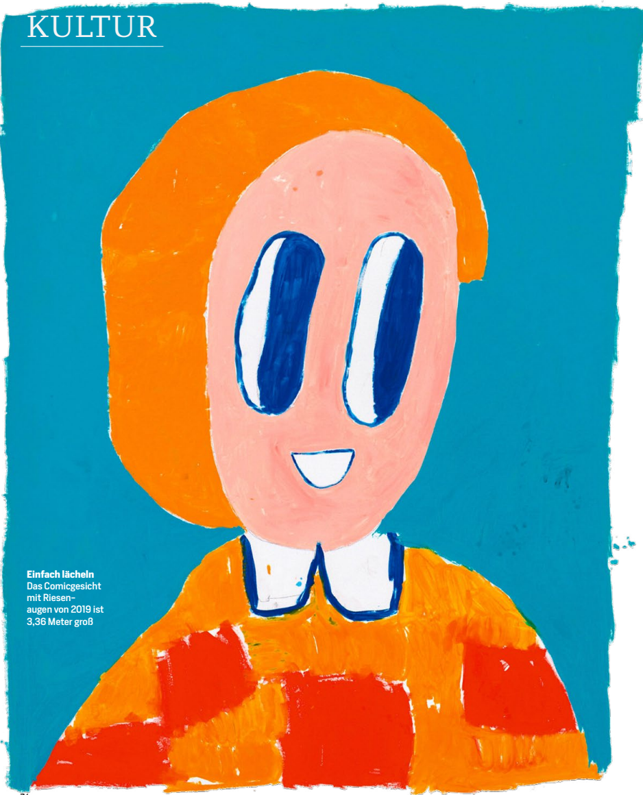
Einfach lächeln Das Comicgesicht mit Riesen- augen von 2019 ist 3,36 Meter groß