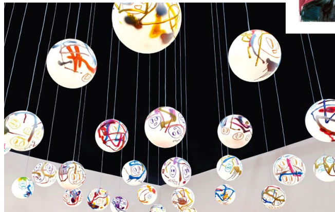
Einfach bemalt Die 100 Leuchten, Stückpreis 10 000 Euro, waren sofort ausverkauft

Es geht so weit, dass ich mich vollständig in ihnen wiedererkenne und dass ich davon überzeugt bin, dass ich und diese Leute dieselben, also identisch sind. Es ging mir vor allem bei Hölderlin so, und ich benenne mich ja selber auch so, ▶