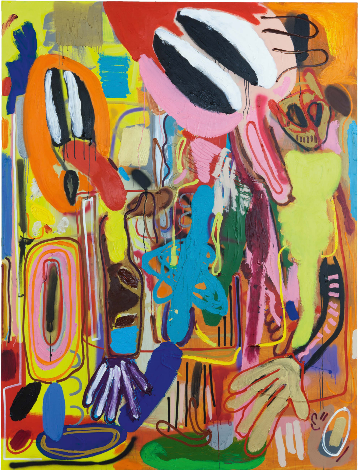
André Butzer, Wer holt die toten Bienen ab? , 2018, Öl und Acryl auf Leinwand, 250 x 190 cm, Courtesy: Galerie Max Hetzler, Berlin | Paris | London, Keith Fox und Tom Keyes, Foto: Sebastiano Pellion