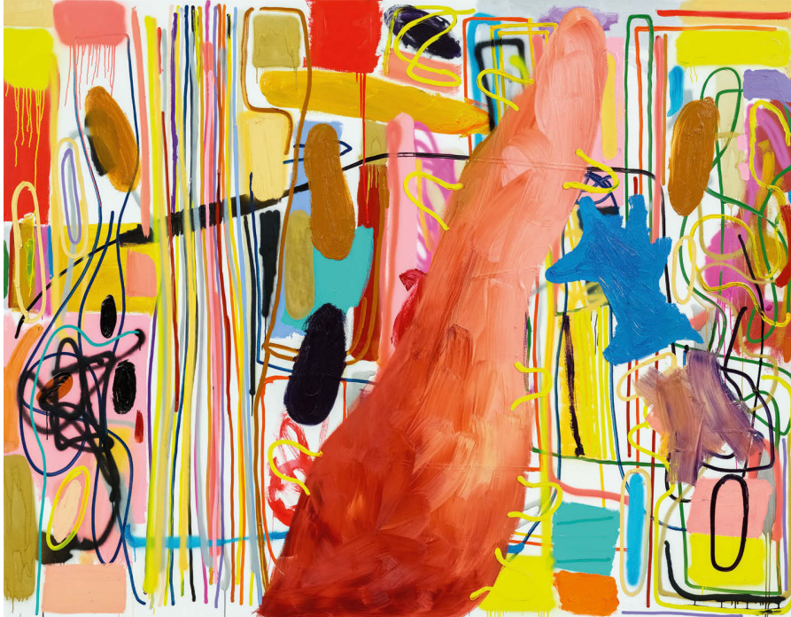
André Butzer, Lunch , 2019, Öl und Acryl auf Leinwand, 213 × 274 cm