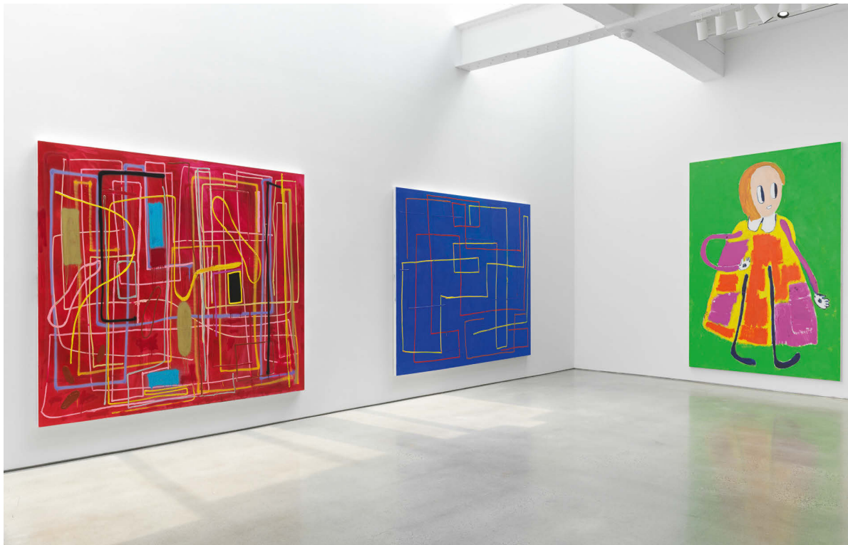
Installationsansicht André Butzer, Metro Pictures , New York, 2019