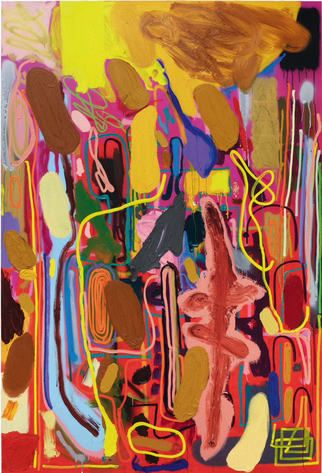
André Butzer, Potatoes , 2019, Öl, Acryl auf Leinwand, 260 × 175 cm, Courtesy: Galerie Max Hetzler und Nino Mier Gallery, Los Angeles, Sammlung Scharpff, Stuttgart/Bonn, Foto: Sammlung Scharpff