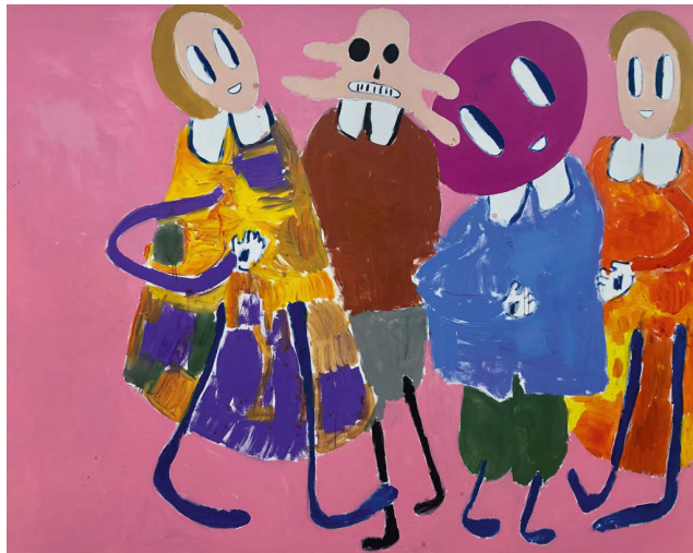
links: André Butzer, Ohne Titel , 2015, Öl auf Leinwand, 300 × 200 cm, Courtesy: Galerie Max Hetzler, Berlin | Paris | London, Sammlung Südhausbau, München, Foto: def image