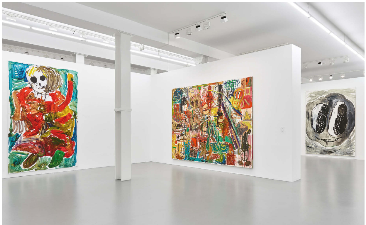
Installationsansicht André Butzer, Galerie Max Hetzler, Berlin, 2018, Courtesy: der Künstler und Galerie Max Hetzler