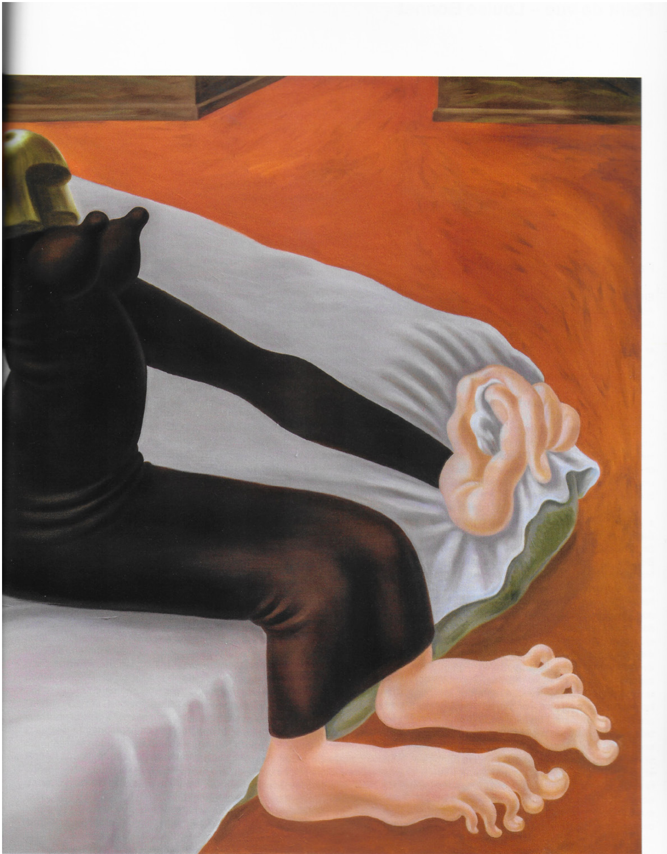
Orange Interior (2019) de Louise Bonnet. Huile sur lin, 182,9 x 304,8 cm.